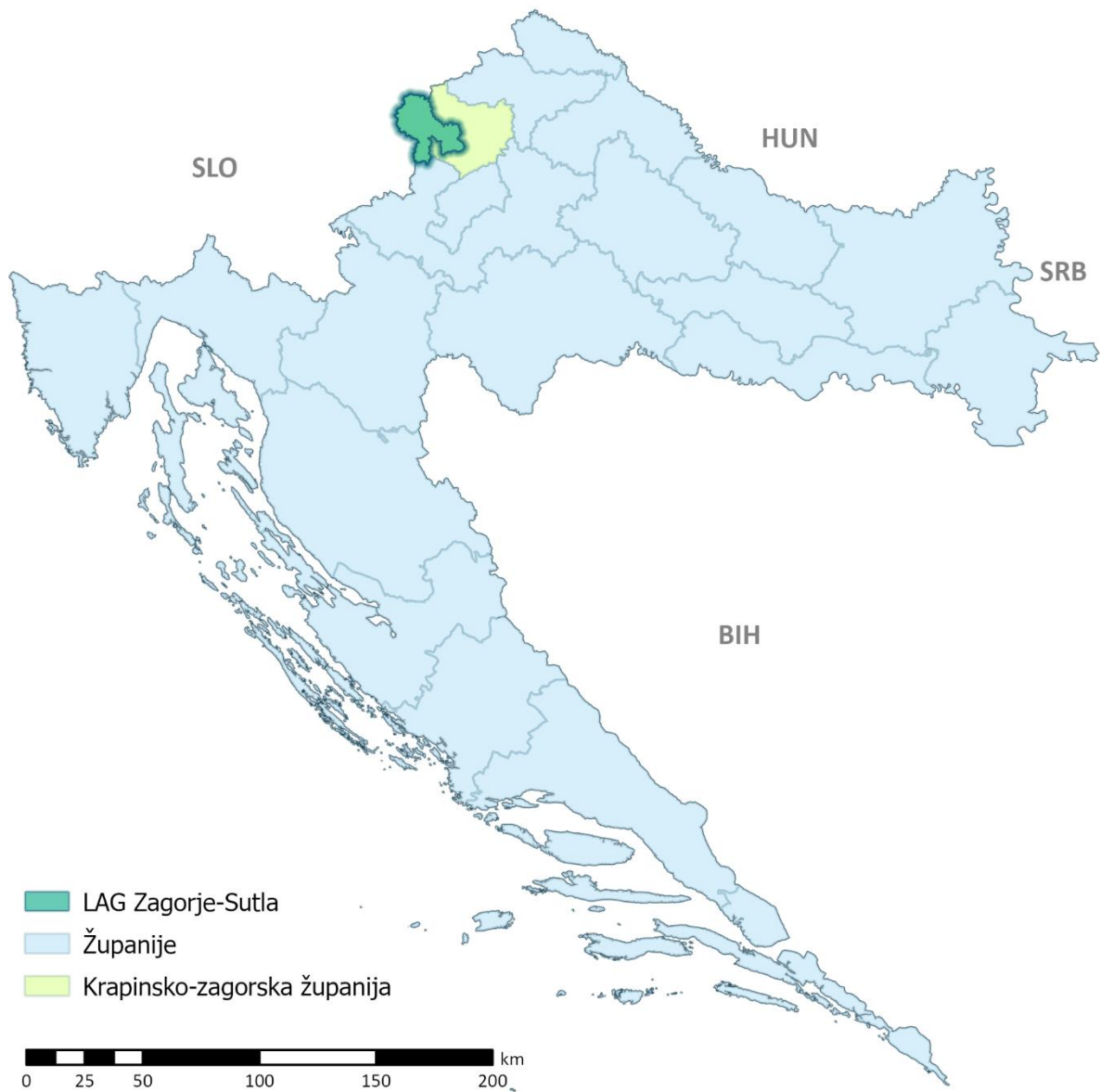
Slika 2: Karta položaja LAG-a na karti Republike Hrvatske