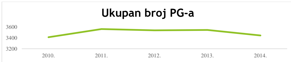
Grafikon 1- Broj PG-a na području LAG-a Zagorje - Sutla u razdoblju 2010. – 2014. godine