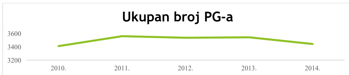
Grafikon 1- Broj PG-a na području LAG-a Zagorje - Sutla u razdoblju 2010. – 2014. godine