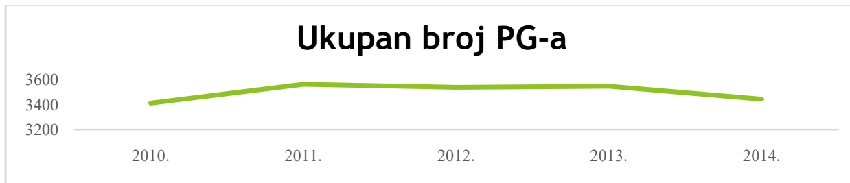
Grafikon 1- Broj PG-a na području LAG-a Zagorje - Sutla u razdoblju 2010. – 2014. godine